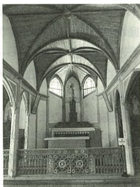
旧五輪教会堂 (五島列島：久賀島)

江戸時代にはとても苦しい生活をしてきた五島の人々でしたが、その中で代々キリシタンの信仰を守り続けた話を多く聞きました。その中でも一番印象に残った話は牢屋の窄殉教