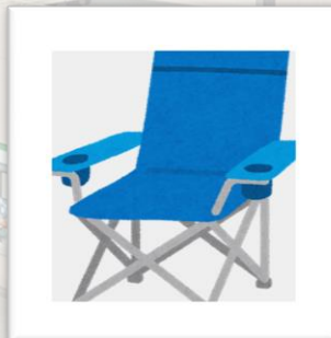
アウトドアグッズ紹介